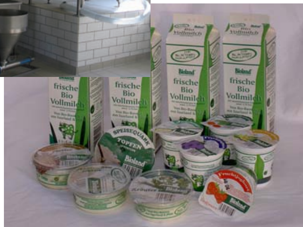
Produkte der Bliesgau-Molkerei

Den Landwirten war klar, um solche Ausfälle künftig zu vermeiden und die Qualitätsstrategie zu ermöglichen, ist eine professionelle Leitung unerlässlich. Mit Unterstützung von Regionen Aktiv stellte die Saarpfälzische Bio-Höfe GmbH daher einen erfahrenen Molkereibetriebsleiter ein. Im August 2006 waren die Qualitätsprobleme gelöst und die Menge der monatlich verarbeiteten Milch stieg von 3.780 Kilogramm im August auf 10.000 Kilogramm im Dezember. Um den Absatz weiter zu steigern, investierten die Wertschöpfungsketten-Unternehmen Anfang 2007 in eine Verbesserung von Vertriebslogistik und Marketing. Mit Hilfe von Regionen Aktiv nahm der Naturkostgroßhandel als wichtigster Absatzpartner ein Kühlfahrzeug in Betrieb und die Erzeugergemeinschaft führte Informationsmaßnahmen durch. Im Oktober 2007