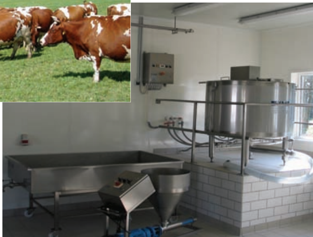
Prozessbehälter in der Molkerei